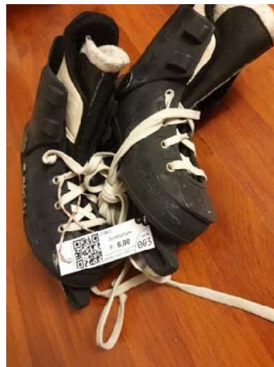
Schlittschuhe, mit Schnur befestigt