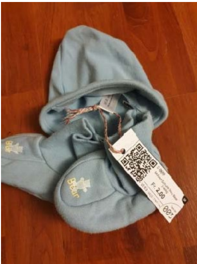
Ensemble 3-teilig, mit Schnur befestigt