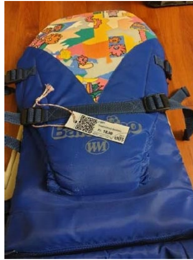
Rucksack, mit Schnur befestigt