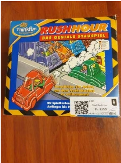
Spiel, mit Klebe-Etikette Herma No 4479 geklebt