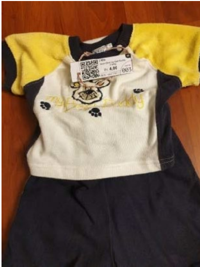
Ensemble 2-teilig, mit Schnur befestigt