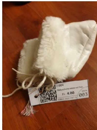
Finken, mit Schnur befestigt